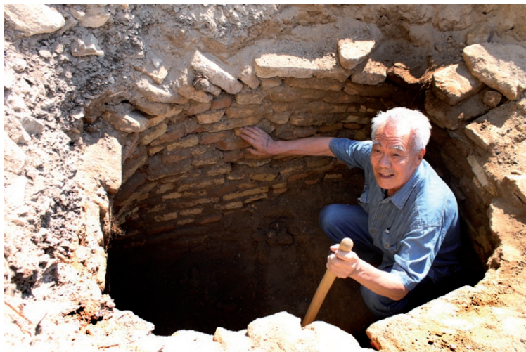
3-сур. Ортағасырлық Сығанақ қаласындағы қазба жұмыстарында. 2017 ж.